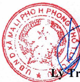
Lý Tràng Pao